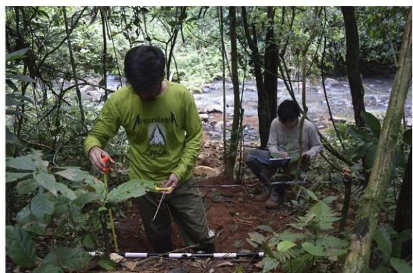
Registro estratigráfico y colecta de sedimentos para análisis de microrrestos botánicos y geoquímica, dirigido por Victor Carrera sob supervisión de Carlos Barbosa.