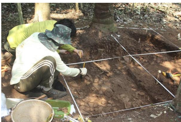
Excavación en una terraza de ocupación alfarería en el sitio arqueológico PA-AT-331 Mangangá, Serra Sul de Carajás.

Durante los cinco años de trabajo en el museo, participé de cursos de capacitación, excavaciones arqueológicas y desarrollé investigaciones científicas financiadas por agencias de fomento como el Conselho Nacional de Desenvolvimento Científico e Tecnológico (CNPq) y la Fundação de Amparo e Desenvolvimento da Pesquisa (FADESP). También participé como voluntario en proyectos de Arqueología del presente, formando parte de diversas charlas y debates sobre los problemas, desafíos y políticas públicas dirigidas al patrimonio urbano.