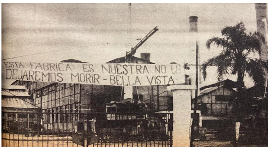
Revista Así, 28 de enero de 1969.

La dirección estuvo a cargo de profesionales del ISES