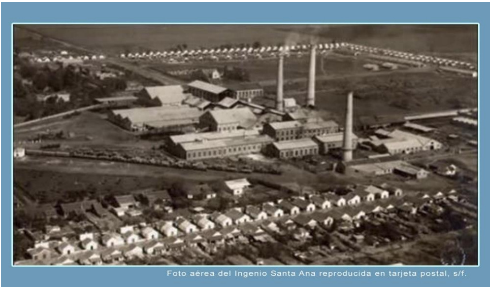
Foto aérea del Ingenio Santa Ana reproducida en tarjeta postal, s/f.