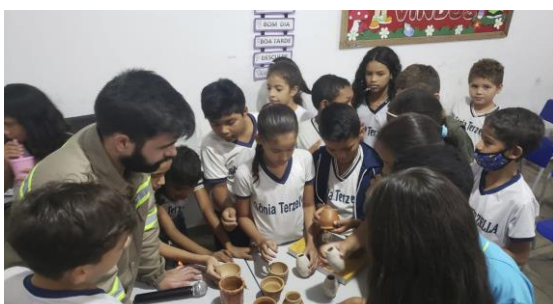
Educación Patrimonial en la Escuela Municipal Sônia Terzello, Municipalidad de Paragominas, Pará.

Entre los años 2015 y 2021 tuve, además, otras experiencias extra-académicas y profesionales en las áreas de Evaluación de Impacto en Patrimonio Arqueológico y Educación Patrimonial (IPHAN, Ley N° 3.924, de 26 de julio de 1961) en ciudades de la Amazonía y Nordeste de Brasil, en las que pude llevar adelante una arqueología más allá de las paredes de universidades y museos.