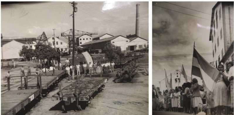
Toma del ingenio en reclamo por la continuidad de funcionamiento ante la clausura de 1963.

distancia de las tradicionales historias de pueblos ceñidas a reconstruir y destacar acontecimientos locales relevantes o recopilar anécdotas representativas. La reformulación historiográfica de los estudios locales expuso la necesidad de restituir los procesos históricos en que los actores sociales construyen el espacio, así como las dinámicas en que forjan y dan sentidos a sus identidades de manera situada.