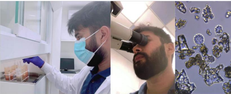
Pasantía en el Laboratorio de Microbotánica para extracción, identificación y análisis de ensambles de fitolitos en suelos arqueológicos de la Amazonía brasileña.

en el cómo llevar a cabo proyectos de investigación y me ayudó a ampliar mi red con otros investigadores. Durante la maestría realicé algunas pasantías, entre ellas la que me acercó por primera vez a la ciudad de San Miguel de Tucumán. Se trató de una pasantía en Metodología Paleobotánica en el Laboratorio Criptogámico de la Fundación Miguel Lillo (UEL-CONICET).