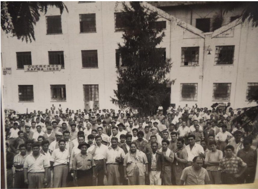
Protesta en reclamo del financiamiento para realizar la molienda de 1965.

En la segunda mitad de la década de 1920 la firma propietaria del establecimiento entró en declive, hasta que en 1932 se declaró en quiebra. La situación activó el reclamo de los agricultores, junto a comerciantes y trabajadores, que demandaron la continuidad de funcionamiento de la fábrica. En un contexto de avanzada de las reivindicaciones de los cañeros independientes, luego del ciclo de movilizaciones agrarias que les permitió incrementar su participación en las ganancias generadas por las actividad azucarera, los agricultores elaboraron proyectos para formar una cooperativa que se hiciera cargo del ingenio.