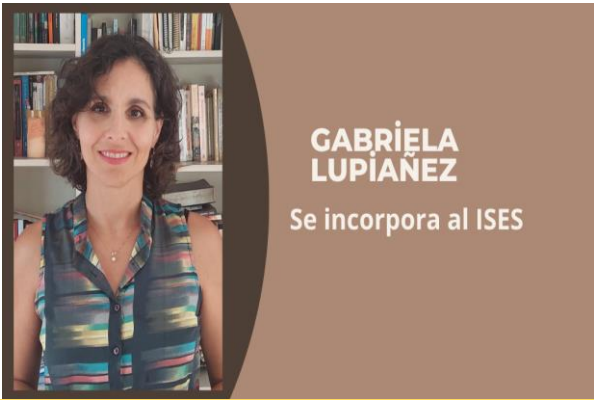
Incorporaciones al ISES